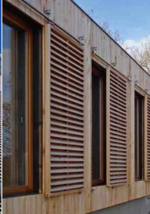
WRC knotty no hole / WRC Clear No. 2 (panely)