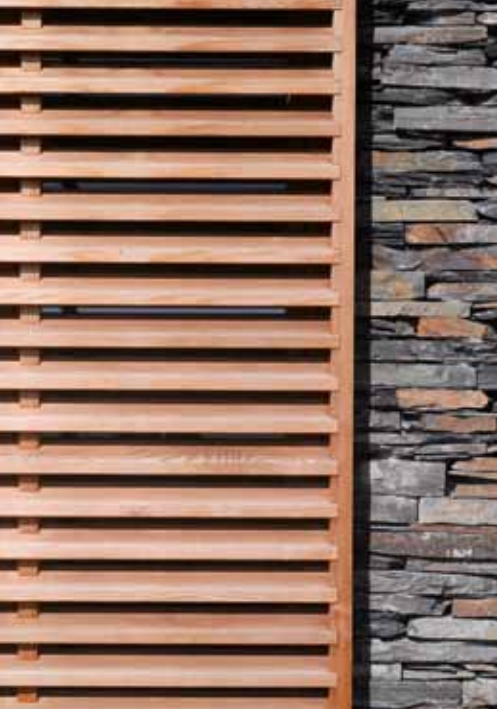
WRC Clear No. 2