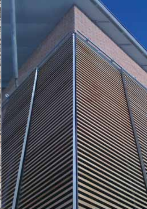
Kov / WRC