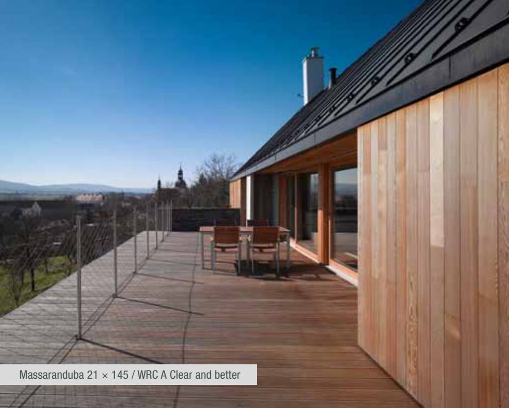
Massaranduba 21 × 145 / WRC A Clear and better