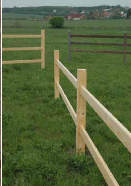
WRC / různé druhy tropického dřeva