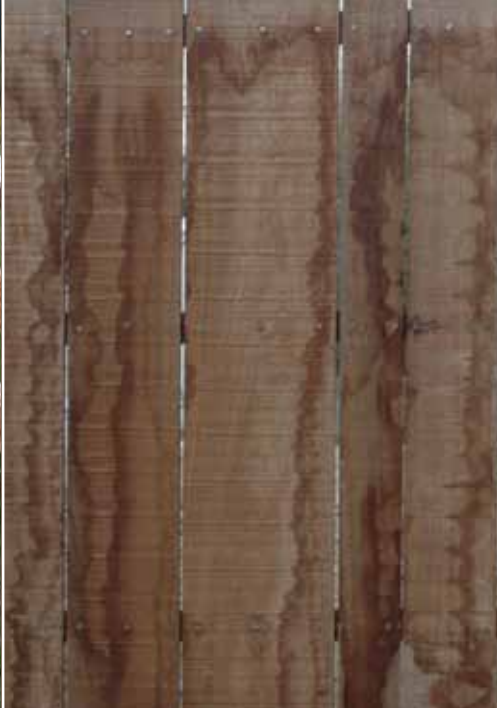
Iroko 27 různé šířky