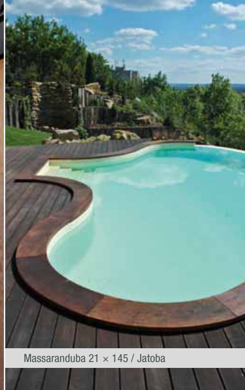
Massaranduba 21 × 145 / Jatoba