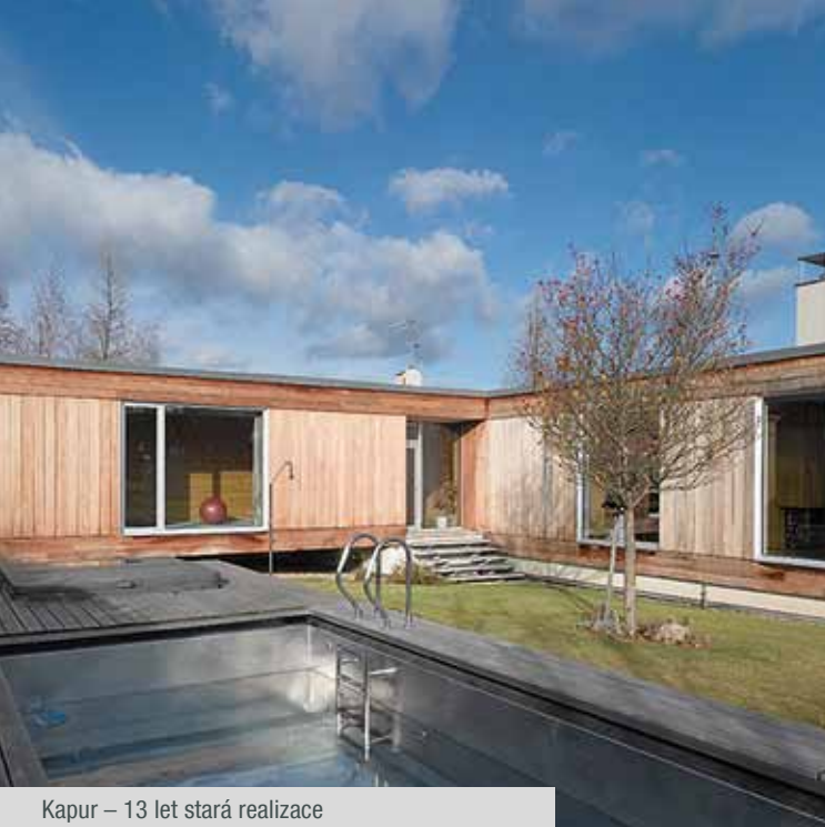
Kapur – 13 let stará realizace