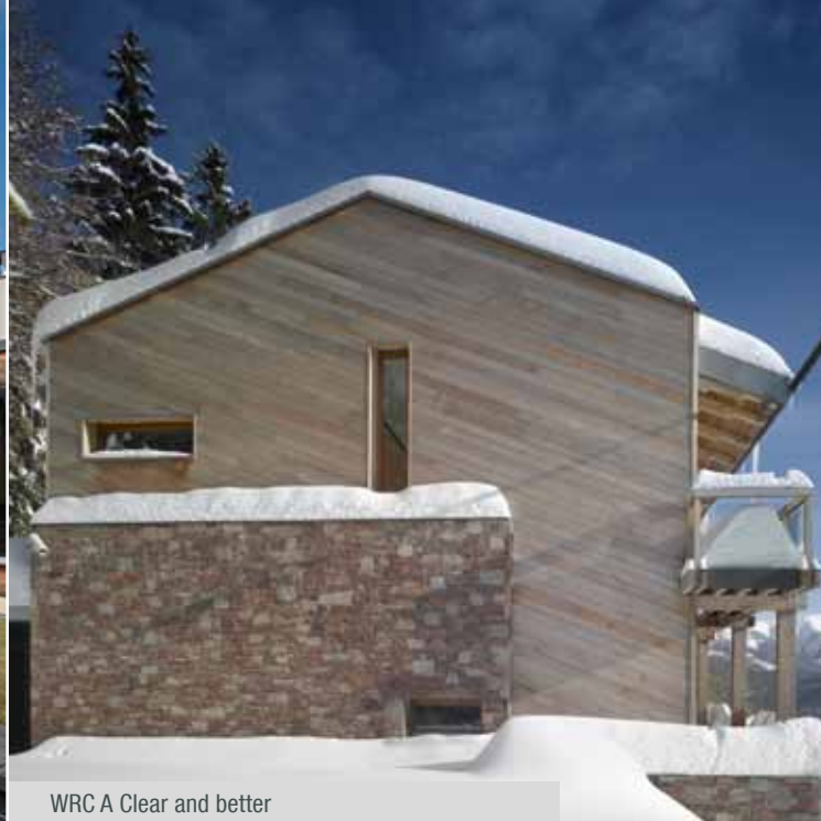
WRC A Clear and better